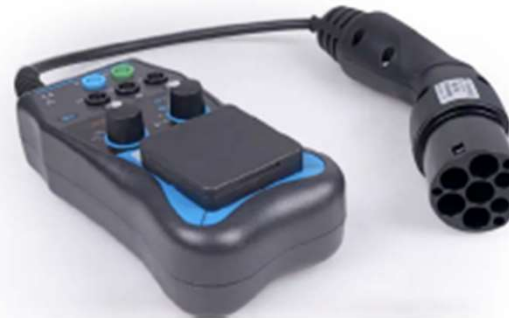
Modèle A1532 Sefram

Profitez d'une offre exceptionnelle et utile pour vos futures installations !